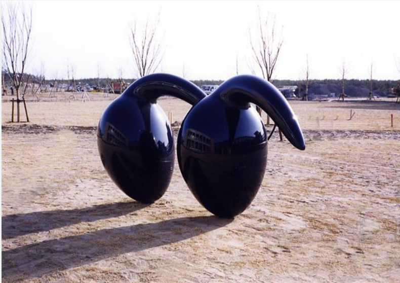
「めばえ」 素材：FRP・木 + 塗装 more information ▶