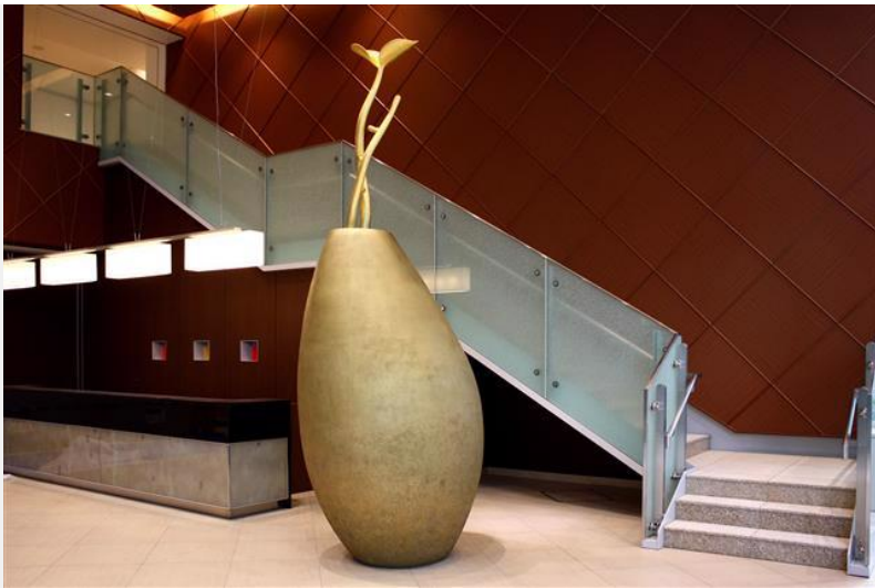
「ジャックと豆の木」 素材：FRP・木 + 塗装 more informations ▶