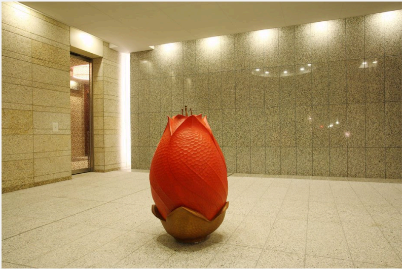
「つぼみ」 素材：木 + 塗装 more information ▶