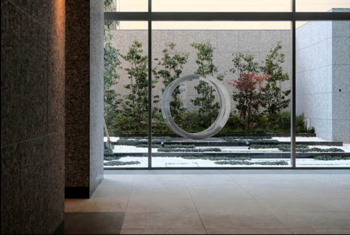
エントランス 1900Φ×650mm ステンレス